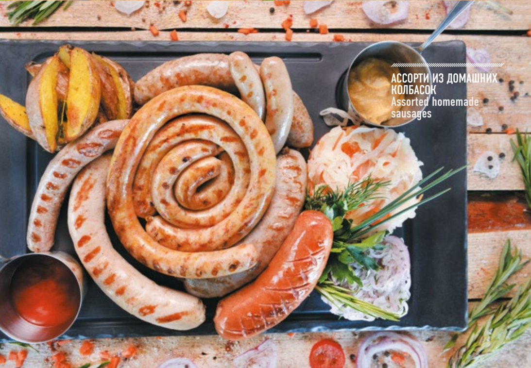
АССОРТИ ИЗ ДОМАШНИХ КОЛБАСОК Assorted homemade sausages