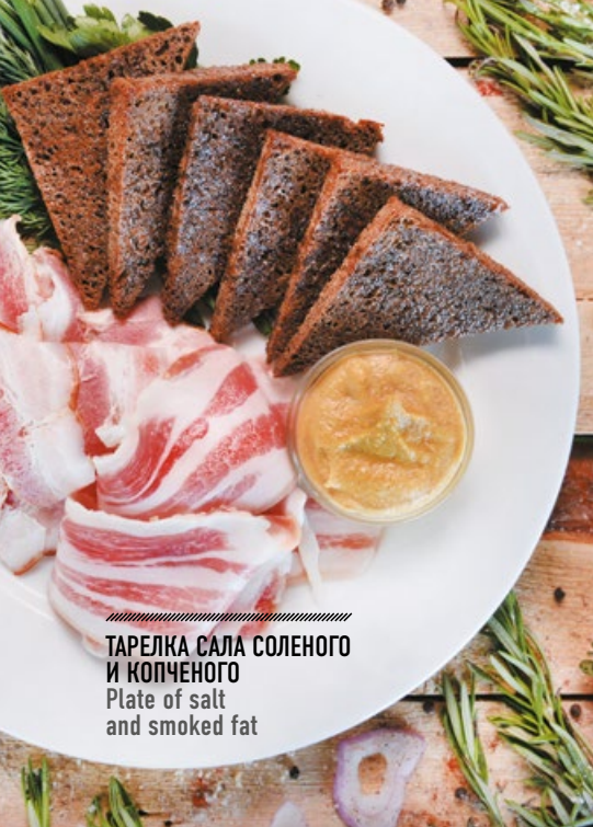
ТАРЕЛКА САЛА СОЛЕНОГО И КОПЧЕНОГО Plate of salt and smoked fat