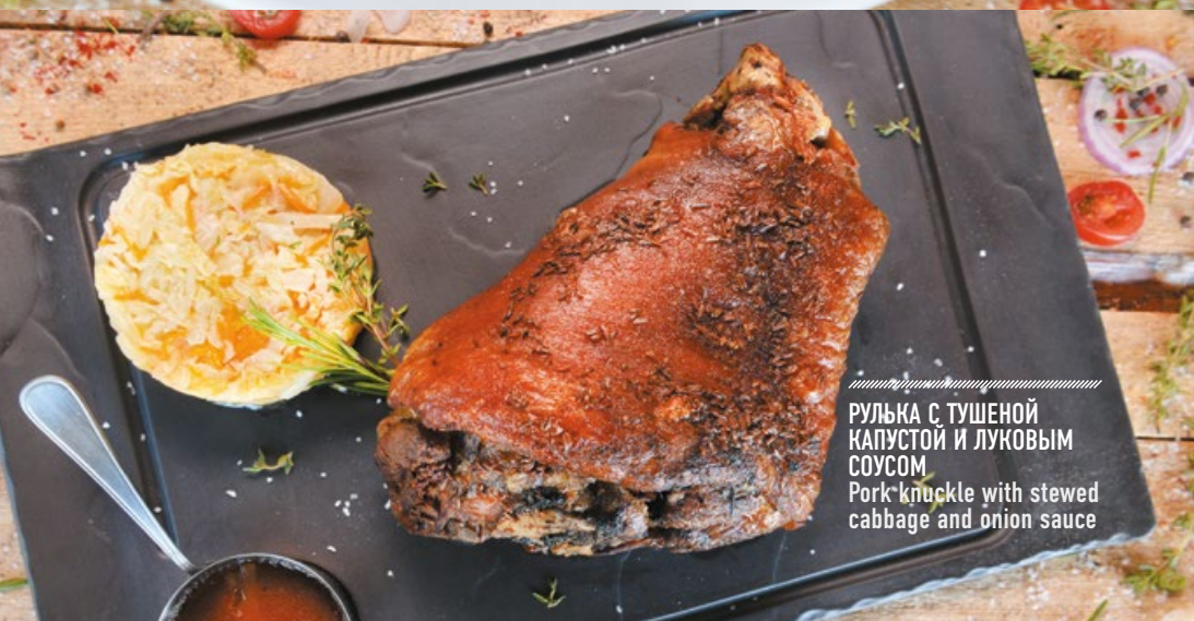
РУЛЬКА С ТУШЕНОЙ КАПУСТОЙ И ЛУКОВЫМ СОУСОМ Pork knuckle with stewed cabbage and onion sauce