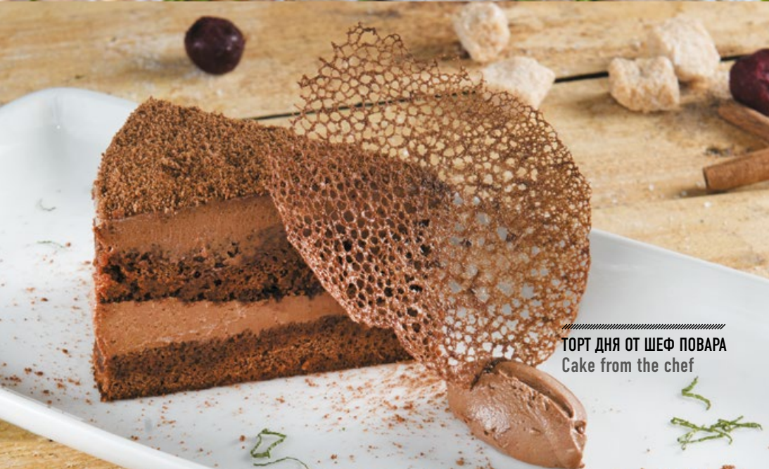
ТОРТ ДНЯ ОТ ШЕФ ПОВАРА Cake from the chef