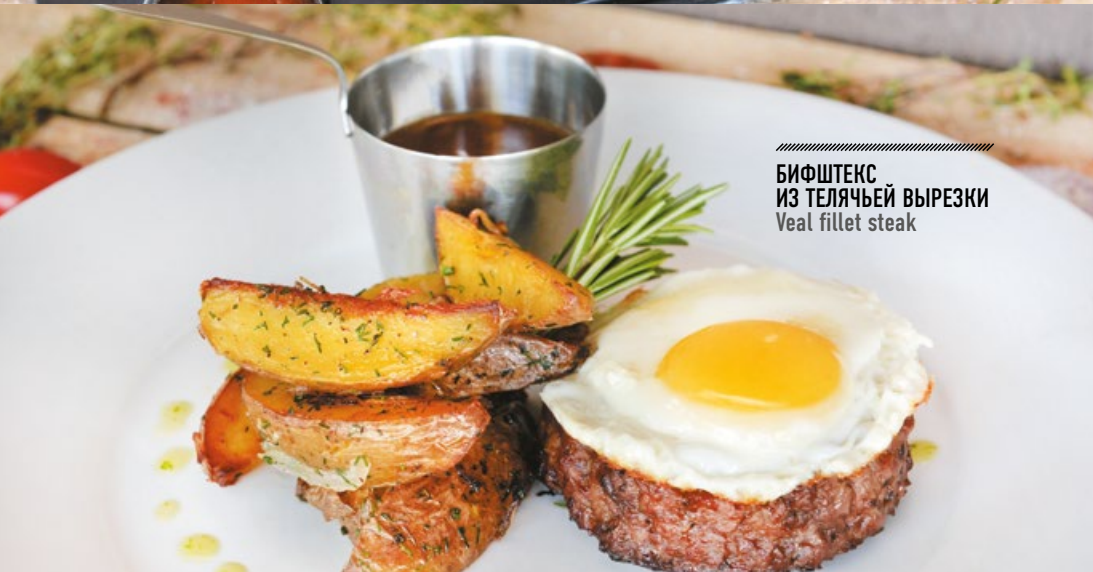
БИФСТЕКС ИЗ ТЕЛЯЧЬЕЙ ВЫРЕЗКИ Veal fillet steak