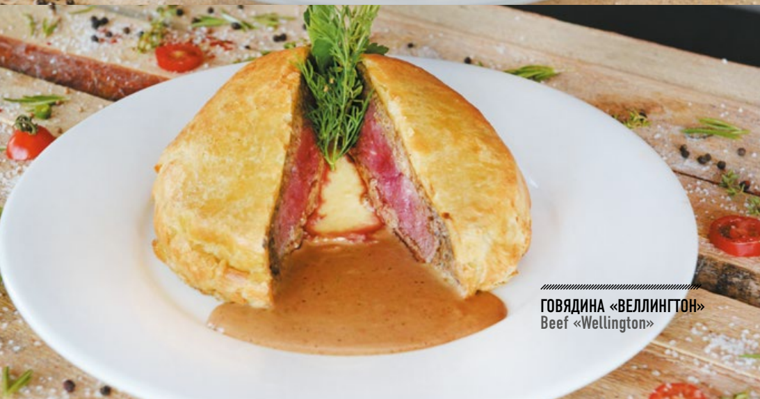
ГОВЯДИНА «ВЕЛЛИНГТОН» Beef «Wellington»