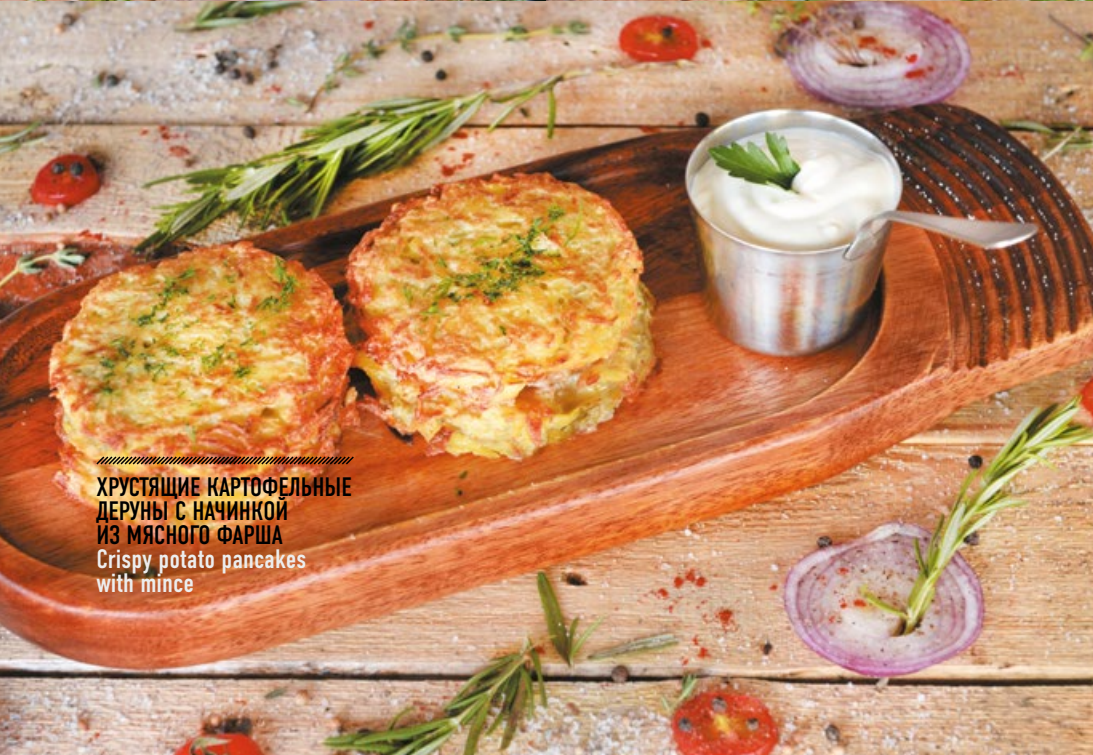
ХРУСТЯЩИЕ КАРТОФЕЛЬНЫЕ ДЕРУНЫ С НАЧИНКОЙ ИЗ МЯСНОГО ФАРША Crispy potato pancakes with mince