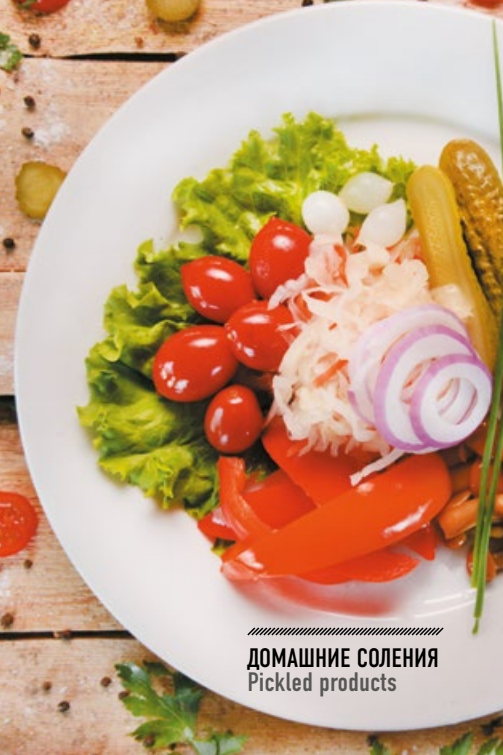
ДОМАШНИЕ СОЛЕНИЯ Pickled products