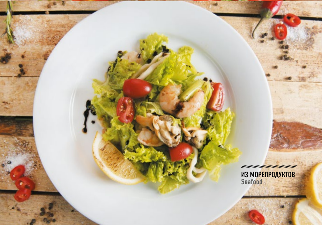
ИЗ МОРЕПРОДУКТОВ Seafood