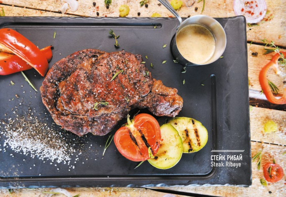
СТЕЙК РИБАЙ Steak Ribeye