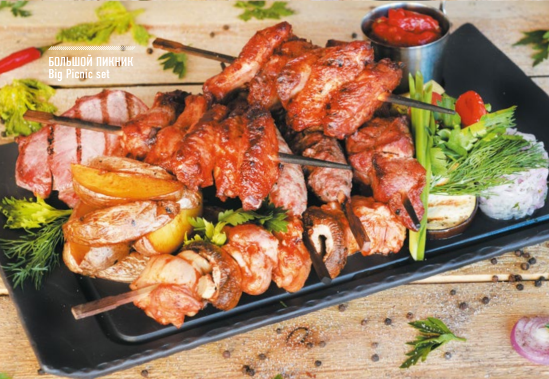
БОЛЬШОЙ ПИКНИК Big Picnic set