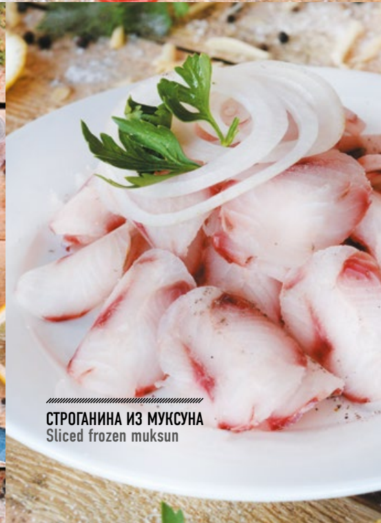
СТРОГАНИНА ИЗ МУКСУНА Sliced frozen muksun