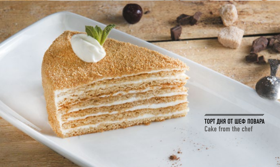
ТОРТ ДНЯ ОТ ШЕФ ПОВАРА Cake from the chef