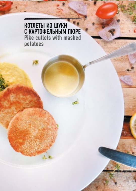
КОТЛЕТЫ ИЗ ЩУКИ С КАРТОФЕЛЬНЫМ ПЮРЕ Pike cutlets with mashed potatoes