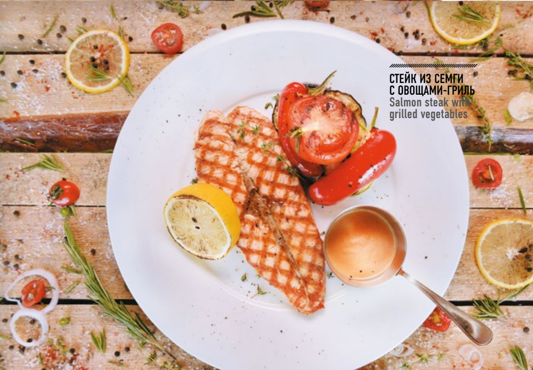
СТЕЙК ИЗ СЕМГИ С ОВОЩАМИ-ГРИЛЬ Salmon steak with grilled vegetables