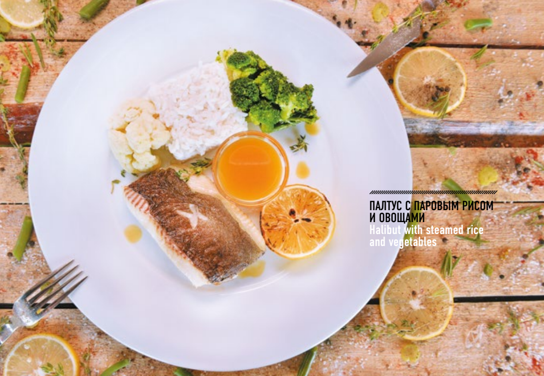
ПАЛТУС С ПАРОВЫМ РИСОМ И ОВОЩАМИ Halibut with steamed rice and vegetables