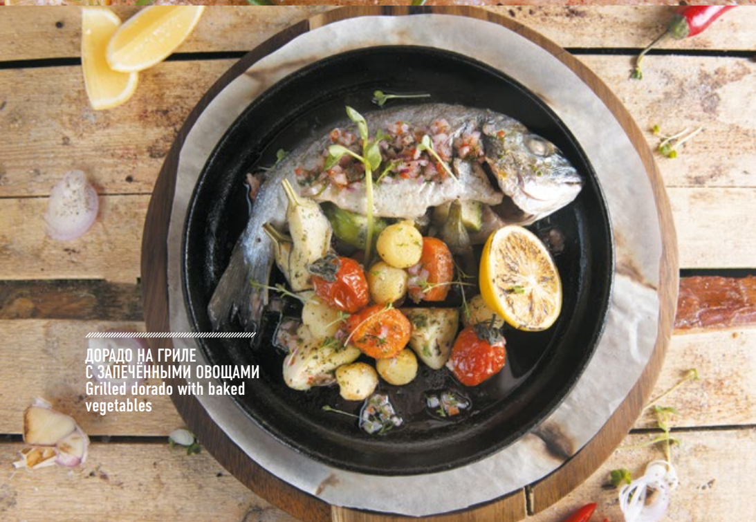
ДОРАДО НА ГРИЛЕ С ЗАПЕЧЕННЫМИ ОВОЩАМИ Grilled dorado with baked vegetables