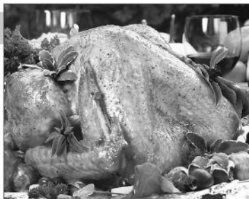
Все блюда готовятся только по предварительному заказу. Подробная информация у менеджера ресторана